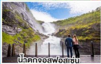
น้ำตกจอสฟอสเซน