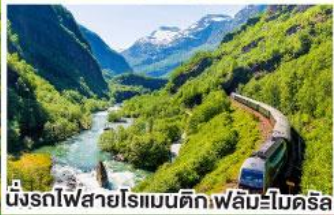
นั่งรถไฟสายโรแมนติกฟิล์มโบเดริล