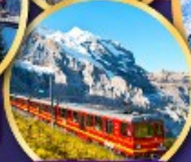
ยอดเขาจุงเฟรา