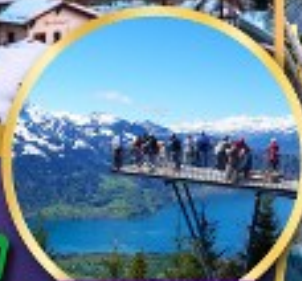
ยอดเขา ฮาร์เตอร์คูลม