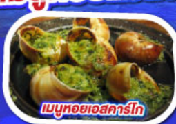
เมนูหอยแอสคาร์โท

ทานอาหาร ณภัตตาคารบนหอไอเฟล พร้อมชมวิวแสนโรแมนติก เมนูหอยแมลงภู่อูบไวน์ขาว