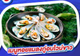
เมนูหอยแมลงภู่อูบไวน์ขาว