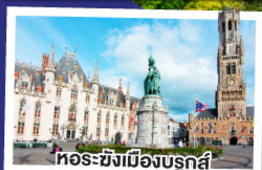
หอระฆังเมืองบรูจส์