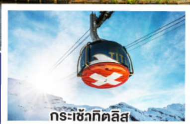
กระเช้าทิลิส