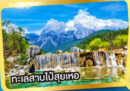
ทะเลสาบไป๋สฺยเหอ