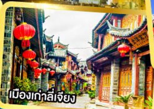
เมืองเก่าลี่เจียง