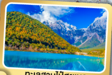
ทะเลสาบไป๋สือเหอ