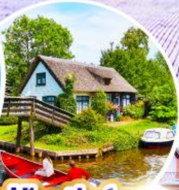
หมู่บ้านกีธูร์น