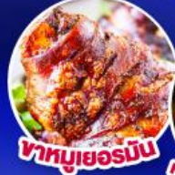
ขาหมูเยอรมัน