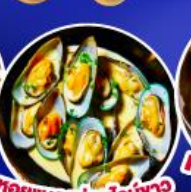
หอยแมลงภู่อบไวน์ขาว