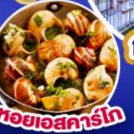
หอยเอสคาร์โท

เดินทาง 17-25 ก.ย.67/11-19,18-26 ต.ค.67 14-22 พ.ย.67/30 พ.ย.-8 ธ.ค.67 25 ธ.ค.67 - 2 ม.ค.68(เทศกาลปีใหม่)