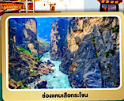
ช่องแคบเลียงกระโจน