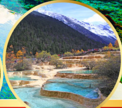
อุทยานหลงหลง