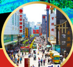
ถนนชุนชิว

-เมนูพิเศษ สุกี้หมาล่าเสฉวน , เปิดปีกกิ้ง