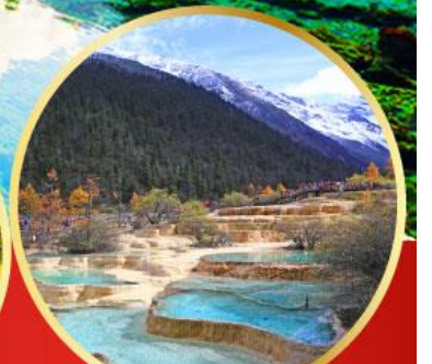
อุทยานหวงหลง