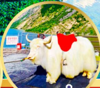
ทะเลสาปเตี้ยซี