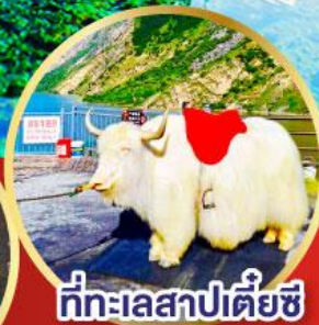
ที่ทะเลสาปเตี้ยซี