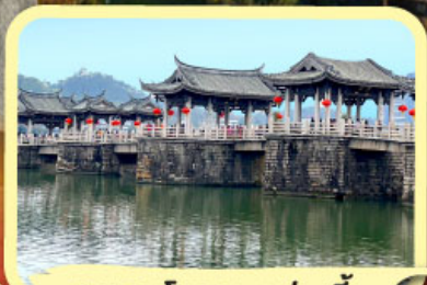
• สะพานโบราณกว่างจี