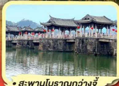
• สะพานโบราณกว้างจี้