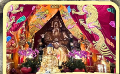
• เอียงบู๊ซิว (ศาลเจ้าพ่อเสือ)