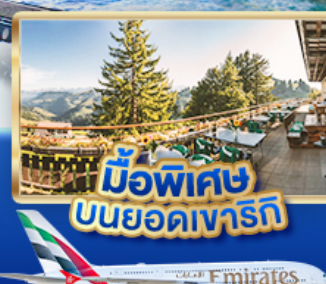
มือพิเศษ บินยอดเขารัก