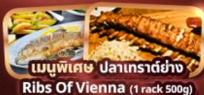
เมนูพิเศษ ปลาเทราต์ย่าง Ribs Of Vienna (1 rack 500g)