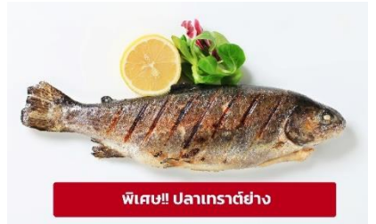
พิเศษ!! ปลาเทราต์ย่าง

เที่ยง ๑๐ รับประทานอาหารเที่ยง (มื้อที่3) เมนูพิเศษ ปลาเทราต์ย่างท่านละ 1 ตัว นำท่านเดินทางสู่ เมืองลินซ์ (Linz) (ระยะทาง 125 กม./ 2 ชม.) เป็นเมืองที่มีการผลิตเหล็ก เครื่องจักร อุปกรณ์ไฟฟ้า อดีตเป็นศูนย์กลางการค้าที่สำคัญ ให้ท่านถ่ายรูปบริเวณด้านนอก พิพิธภัณฑ์แห่งโลกอนาคต (Ars Electronica Center) ตั้งอยู่ริมแม่น้ำดานูบ เป็นที่จัดแสดงวิทยาการต่างๆ ที่ส่งผลต่อมวลมนุษยย์ปัจจุบัน ไม่ว่าจะเป็นอวกาศ หุ่นยนต์และเอไอ ยารักษาโรค เป็นต้น