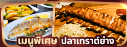
เมนูพิเศษ ปลาเทราต์ย่าง Ribbs Of Vienna (1 rack 500g)