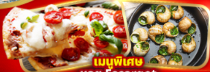
เมนูพิเศษ หอย Escargot Pizza Margherita 1 ถาด

อิตาลี มหาวินาศดูโอโม ชมสิ่งมหัศจรรย์โลก โคลอสเซียม หอเอนปิซ่า สวิส พิธีชงชาของเฟรรา "TOP OF EUROPE" สะพานไม้ชาเปล รูปปั้นสิงโต ฝรั่งเศส เข็มอินปารีส หอไอเฟล ประตูชัย นั่งรถกระเช้าไฟฟ้ามงต์มาตร์ ล่องเรือแม่น้ำแซนชมเมือง ซุปป์ิงแบร์นเดนมหำปลอดภาษี เฮกท์เล็ก