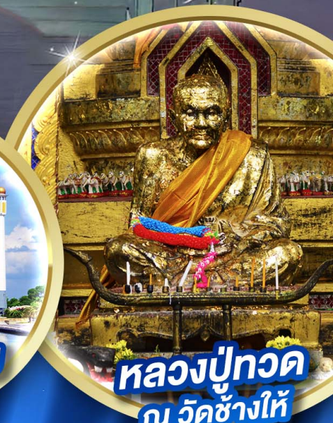
หลวงพ่อทวด ณ วัดช้างให้