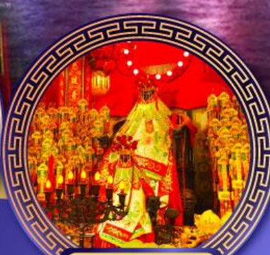
วัดเจ้าแม่กวนอิม ฮ่องกง