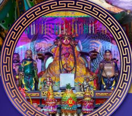
ศาลเจ้าหังเจีย