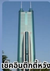
เซินเจิ้นตึกตี๋ห้วง