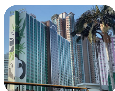
Panda Hotel (ซุนหวาน)