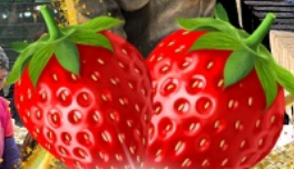
มีผลตอบเอบอจึสุด ๆ จากรั้