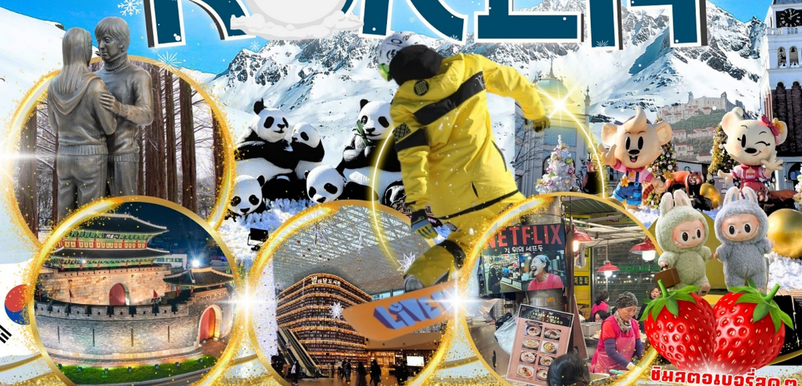
ป้อมฮวาซอง