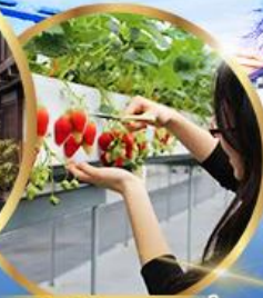
บุฟเฟต์ สดอเบอร์รี่