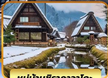
หมู่บ้านชิราคาวาโกะ