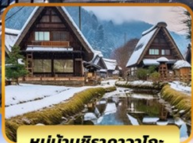
หมู่บ้านชิราคาวาโกะ

โซาก้า คุสัทซึ คาวาโกเอะ ทากายามา โตเกียว