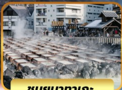
ชมยูบาทาเกะ