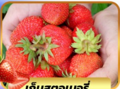
เก็บสตอเบอร์รี่