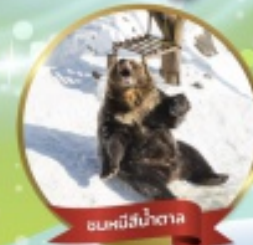
ฟาร์มหมีสึน้ำตาล