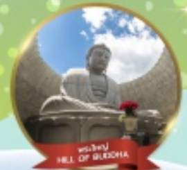
พระใหญ่ HILL OF BUDDHA