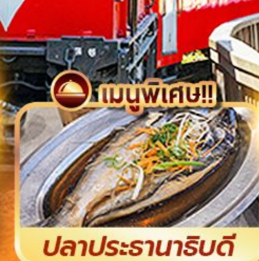
เมนูพิเศษ!! ปลาประดาน้ำริบตี