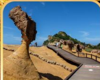
อุทยานหินเหย์หลิว