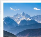
ภูเขาหิมะเหมย์หลี่