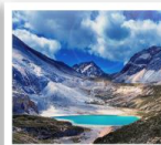
ทะเลสาบน้ำนม