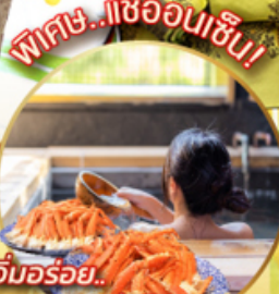
อิมมอร์รี่... บุฟเฟ่ต์ขาปู

ไฮไลท์!! ไฮไลท์ อลังการไฟล้านดวง ณ หมู่บ้านนาบะโนะ โนะ ซาโตะ สักการะพระใหญ่ โดบุทสึ และชมเมืองกลาง เมืองนารา ชมวัดทองคินคะคุจิ เยือนวัดน้ำใสคิโยมิสึเดระ เล่นสกี ณ ฟุจิกินสกีรีสอร์ท ซอปปิง ย่านชินไซบาชิ และชินจูกุ ไม่พลาด!! บุฟเฟ่ต์ขาปูและแช่ออนเซ็น