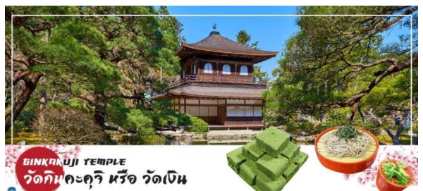
GINKAKUJI TEMPLE วัดกินคะคุจิ หรือ วัดเงิน

จากนั้นนำท่านสู่ วัดกินคะคุจิ (Ginkakuji Temple) หรือ วัดเงิน (ใช้ระยะเวลาในการเดินทางประมาณ 15 นาที) เป็นอีกหนึ่งในสถานที่ที่ขึ้นทะเบียนกับองค์การยูเนสโกให้เป็นมรดกโลกด้านวัฒนธรรม ซึ่งวัดกินคะคุจิเป็นวัดนิกายเซน ถูกสร้างขึ้นโดยโชกุนอชิคากะ โยชิมาสะ หลานชายของท่านโชกุน ที่สร้างวัดกินคะคุจิ (Kinkakuji Temple) หรือ ที่รู้จักกันอย่างกว้างขวางว่าวัดทองสำหรับอาคารของวัดเงิน สร้างขึ้นในรูปแบบเดียวกัน เพียงแต่จะไม่ได้มีสีทอง เป็นอาคาร 2 ชั้น และมีนกฟีนิกซ์อยู่บนหลังคา