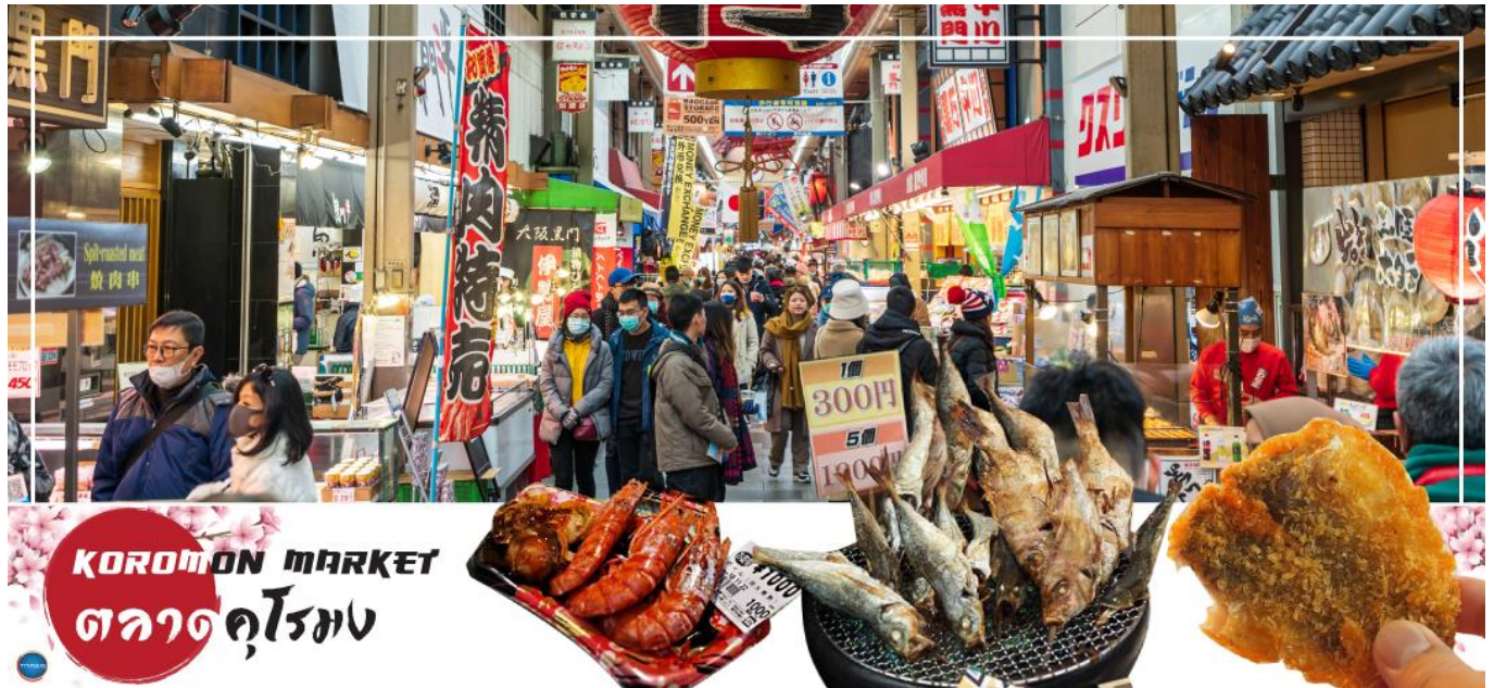
KUROMON MARKET ตลาดคุโรมง

จากนั้นนำท่านเดินทางสู่ ตลาดคุโรมง โอซาก้า (Kuromon Ichiba Market) เป็นตลาดที่มีชื่อเสียงและเก่าแก่ที่สุดแห่งหนึ่งของเมืองโอซาก้า บรรยากาศภายในเป็นทางเดิน Arcade เล็กๆ ทอดยาวประมาณ 600 เมตร 2 ข้างทางจะเต็มไปด้วยร้านค้าต่างๆกว่า 160 ร้านค้าขายทั้งของสด และแบบพร้อมทาน มีของกินเล่นและอาหารพื้นเมืองมากมายหลายชนิดให้ได้ชิมกัน