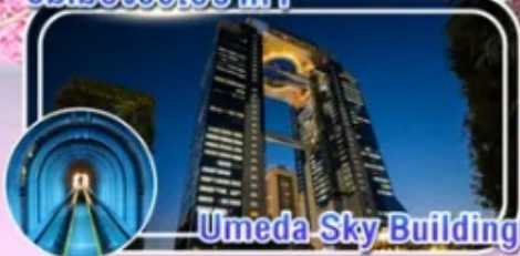
Umeda Sky Building