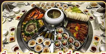
อิ่มอร่อยกับ..เมนูหม้อหนึ่งจักรพรรดิ เสี่ยวหลงเปา ซาบูนูฟัสโตลส์ไต้หวัน