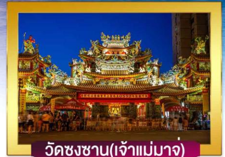
วัดชงซาน(เจ้าแม่มาตุ)