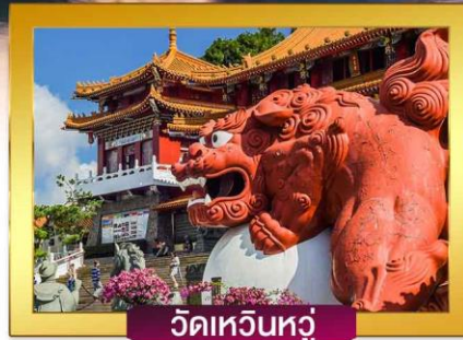
วัดเหวินหัว