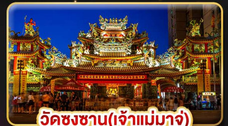
วัดชงชาน(เจ้าแม่มาจู่)