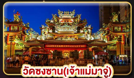
วัดชงชาน(เจ้าแม่มาจู่)