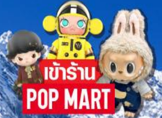
เข้าร้าน POP MART