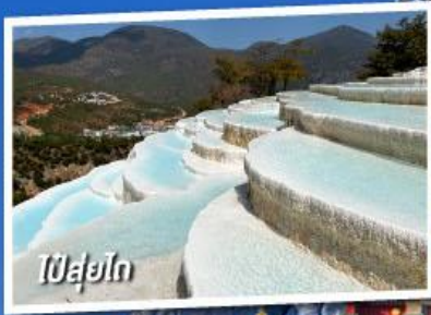
ป๋ายป๋าย

เที่ยวครบทุกไฮไลต์ • ไม่ลงร้านช้อปปิ้ง • พักโรงแรม 4 ดาว