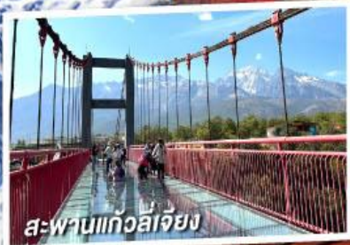
สะพานแก้วลี่เจียง