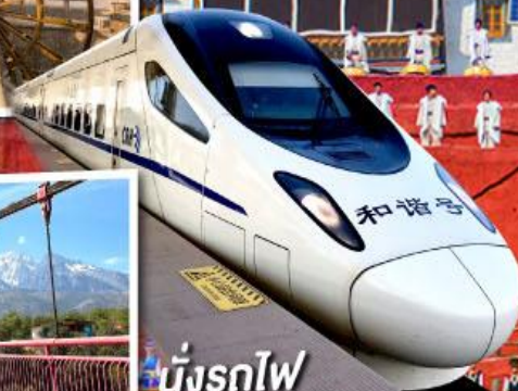
นั่งรถไฟ ความเร็วสูง