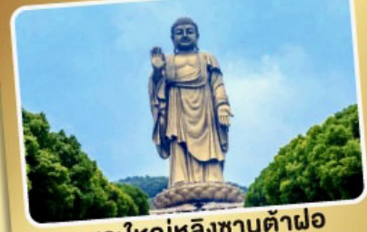
พระใหญ่หลิงซานต้าฝอ

เมนูพิเศษ! ซีโครงหมูอู๋ซี, เสี่ยวหลงเปา, ชาบูหมาล่า