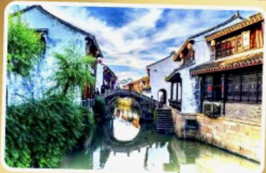
เมืองโบราณเยี่ยเหอ