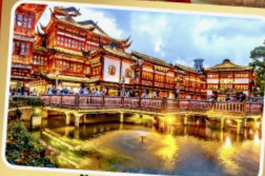
ตลาดร้อยปีเจิ้งหวังเมี่ยว