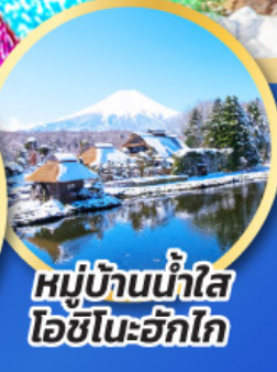
หมู่บ้านน้ำใส ไอชิโนะอัทสึ