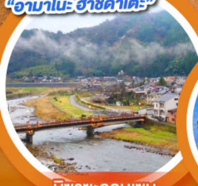
มิซาซะออนเซน