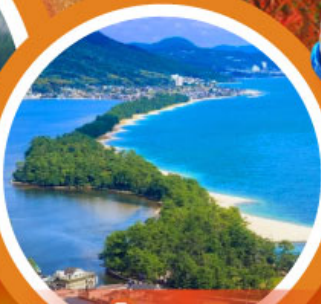
อามาโนะ ฮาซิดาเตะ