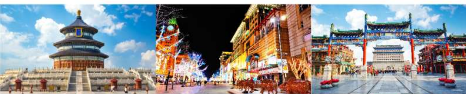
หอบูชาฟ้าเทียนถาน