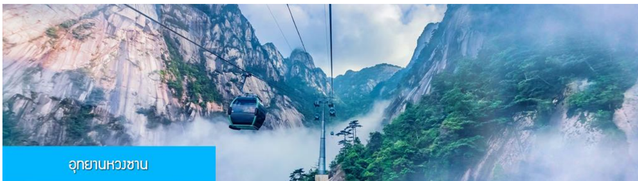
อุทยานหวงซาน

วันที่ห้า เมืองหวงซาน –พักผ่อนตามอัธยาศัยในโรงแรม หรือท่านสามารถซื้อโปรแกรมทัวร์เสริมเที่ยวเขาหวงซาน – พิพิธภัณฑ์อาหารพื้นเมือง