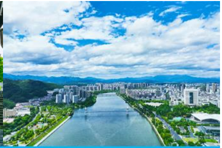
เมืองหวงซาน