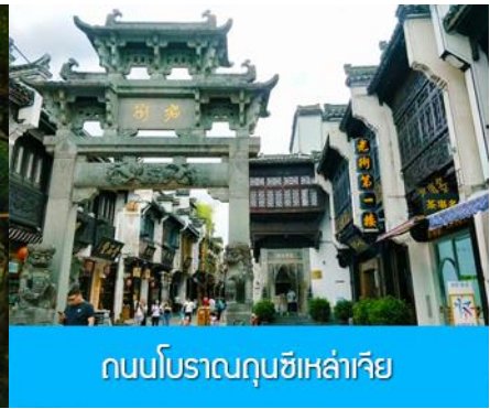
ถนนโบราณถนนซีหล่าเจีย

วันที่หก เมืองหวงซาน –หมู่บ้านโบราณซีซีหนานซุน –อิสระ ณ ถนนโบราณถนนซีและย่านศูนย์การค้า – เดินทางกลับกรุงเทพฯ