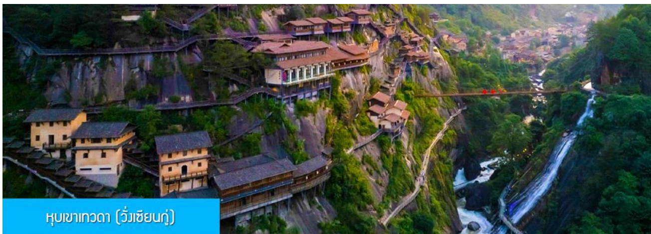
หุบเขาเทวดา (วังเซียนกู่)