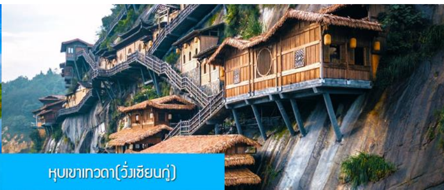
หุบเขาเทวดา(วังเซียนกู่)