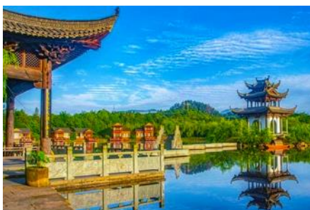
หมู่บ้านโบราณ สู่มีว้ซ้งเหอ