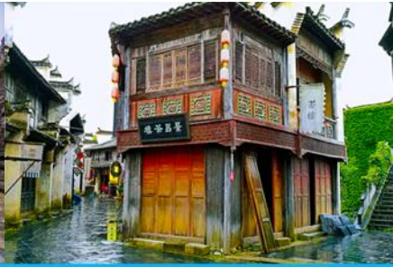
โรงถ่ายภาพยนตร์ซีวหลี่