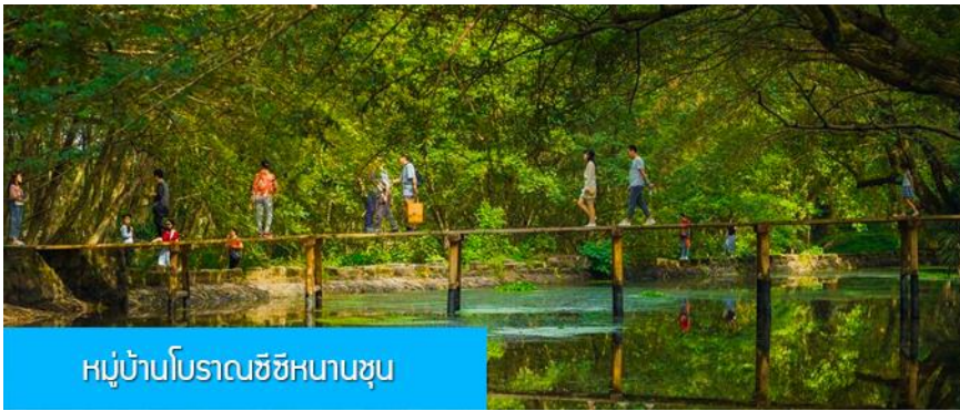
หมู่บ้านโบราณซีซีหนานซุน