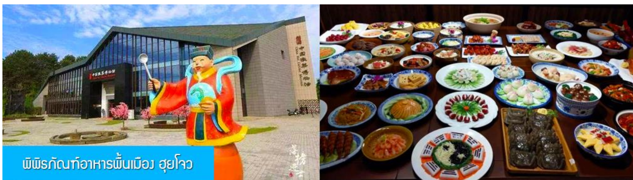
พิพิธภัณฑ์อาหารพื้นเมือง ฮุยโจว

เที่ยง อาหารเช้ามื้อกลางวัน ( ท่านสามารถเลือกชิมอาหารพื้นเมืองในระแวกโรงแรมได้ตามอัธยาศัย )