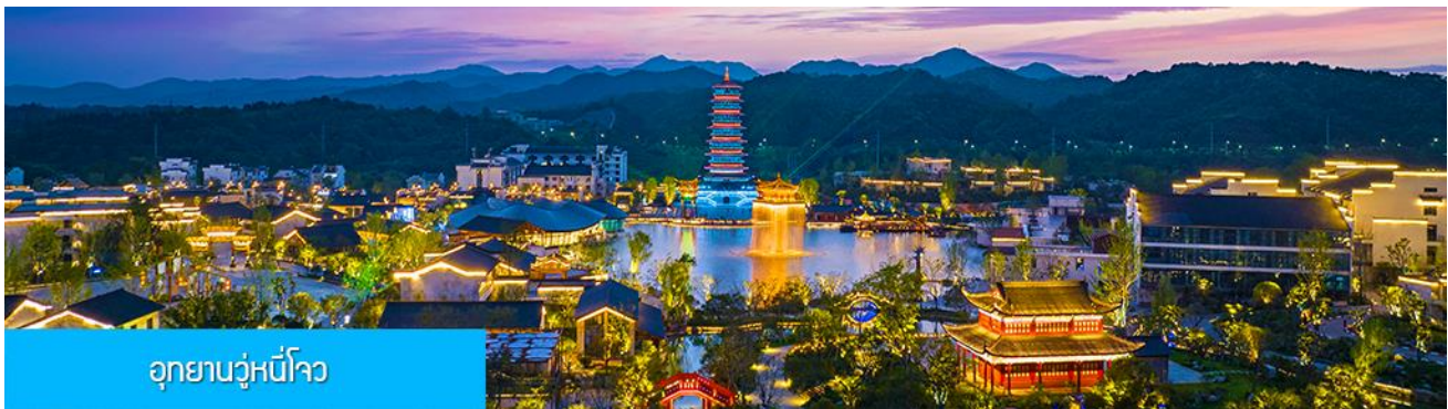
อุทยานวู่หนี่โจว