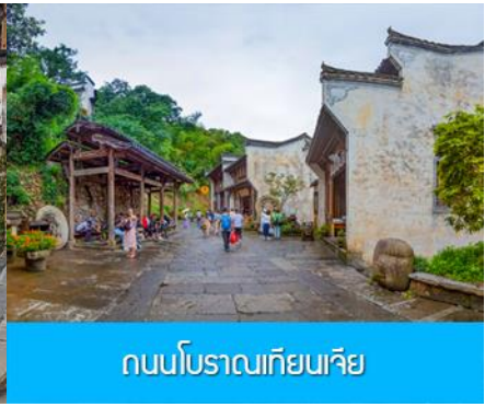
ถนนโบราณเทียนเจีย