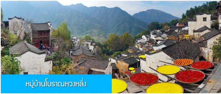
หมู่บ้านโบราณหวงหลิ่ง