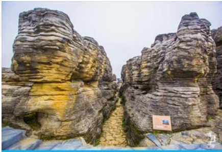
อุทยานป่าหินล้านปี