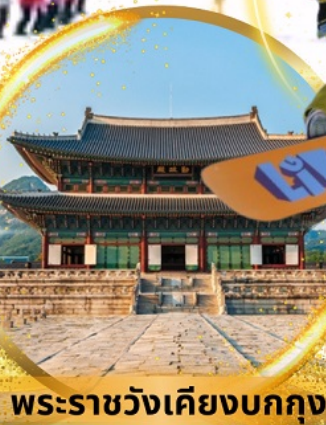
พระราชวังเคียงบกกรุง