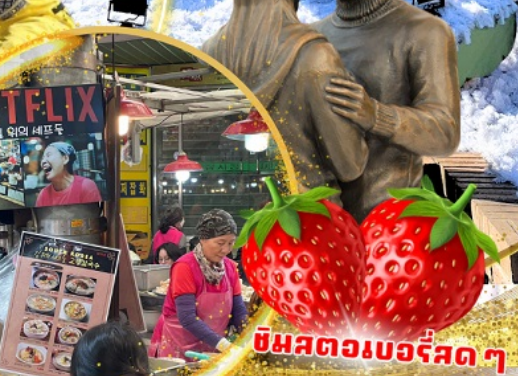
ตลาดกวางจง