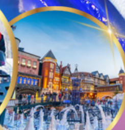
โรงงานช็อคโกแลต ชิโรอิ โคอิโมโตะ

ราคา เริ่มต้น 36,919 บาท รวมภาษีมูลค่าเพิ่ม 7%