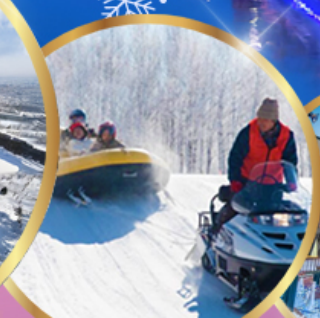
ซิกิไซ สโนว์แลนด์