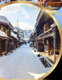
ตากายาม่า