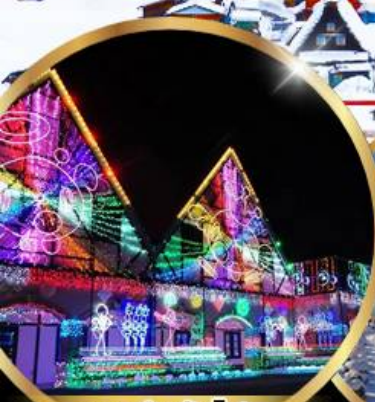
งานประดับไฟ Tokyo german village