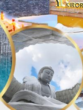
เป็นเขาแห่งพระพุทธเจ้า