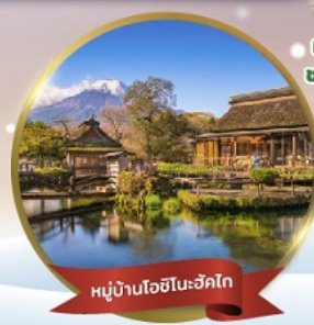
หมู่บ้านโอชิโนะฮักโก