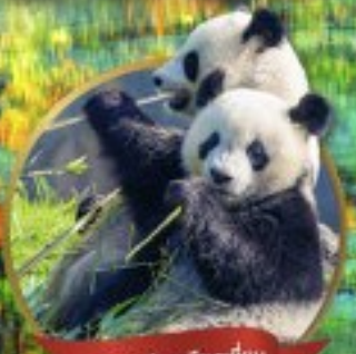
หิมะแพนด้ายี่ปิ่นตึก