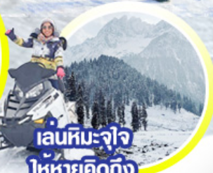
เล่นหิมะ-จาว ให้หายคิดถึง