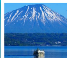
ค่องเรือทะเลสาบโทเยะ