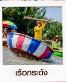
เรือกระด้ง