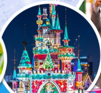
สวนสนุกคิวดเต้