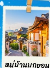
หมู่บ้านนุกซอน