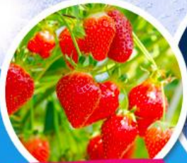
ไรสตอร์จิวเมอริรี่