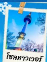
โซลทาวเวอร์