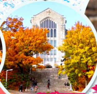
มหาวิทยาลัยฮิวา