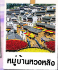
หมู่บ้านทวงหลิง