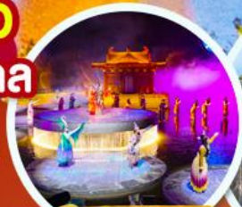
ชมโชว์อั้งการ