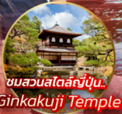
ชมสวนสไตลญี่ปุ่น.. Ginkakuji Temple