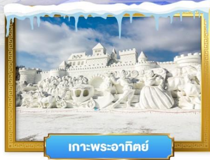
เกาะพระอาทิตย์