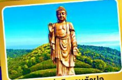
พระใหญ่หลิงซานต้าฝอ