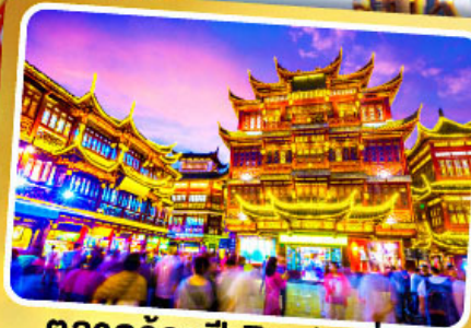
ตลาดร้อยปีเจิ้งหวังเมี่ยว