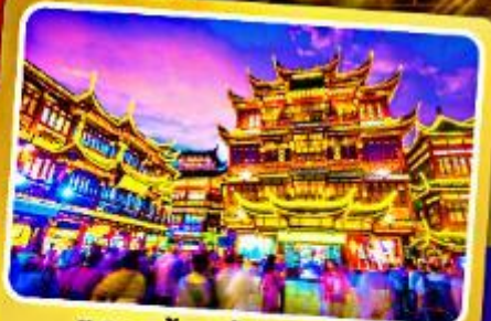
ตลาดร้อยปีฉงหวังเหมี่ยว