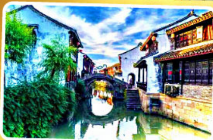
เมืองโบราณเยี่ยเหอ