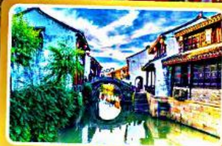
เมืองโบราณเหยี่ยวหอ