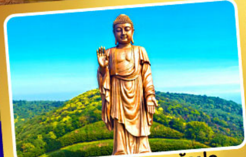
พระใหญ่หลังซานต้าฝอ