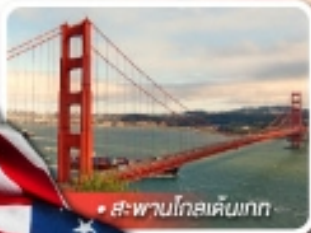
สะพานโกลเด้นเกต