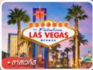
ลาสเวกัส