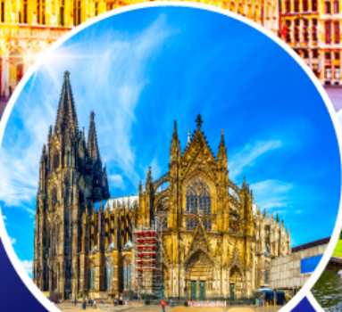
มหาวิหารแห่งโคโลญ