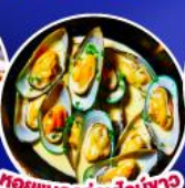
หอยแมลงภู่นิวอิงา