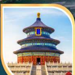
หอฟ้าเทียนกาน