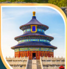
วิหารเซนต์ปอล โรงละครหอยไข่มุก หอฟ้าเทียนถาน